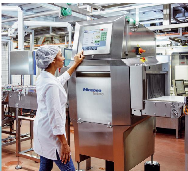
Dymond X-ray sustav za inspekciju iznimno je jednostavan i intuitivan za korištenje zahvaljujući vođenim funkcijama

metala, već također može prepoznati odstupanja u konzistenciji proizvoda. Tako su postavke sustava uspješno izmijenjene. Od tada je sustav pouzdano uklonio ne samo kontaminirane proizvode iz protoka proizvoda, već i podstandardne proizvode.