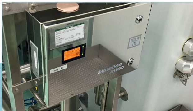
Minebea Intec mjerne ćelije i elektronika za vaganje pružaju pouzdano vaganje procesnih posuda