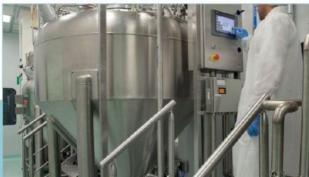
LDO je globalni stručnjak za proizvodnju heparin-natrija, heparin-kalcija i heparinoida

Minebea Intec mjerne ćelije i elektronika za vaganje higijenskog dizajna, zadovoljile su LDO potrebe: 2016. godine potvrđeno je talijansko odobrenje AIFA, a također je postignuta i FDA usklađenost za API proizvodnju, što mu omogućuje otvaranje ka novom, velikom tržištu, poput Amerike.